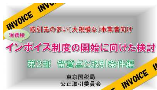
インボイスQ&Aの説明動画