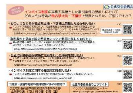
インボイスQ&Aの案内紙