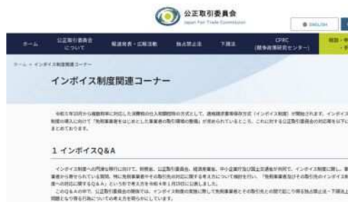
公正取引委員会ウェブサイト